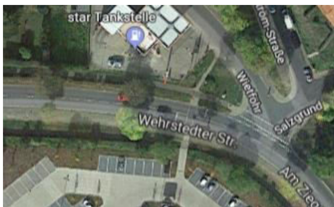
Abb. 2: Wehrstedter Str./ Fußgängerampel. Blick auf das Preisschild der Star Tankstelle nimmt man die Rotphase der Ampel nicht immer wahr. Maßnahmen zur Geschwindigkeitsverringern (z.B. Tempo 30) sind wünschenswert.